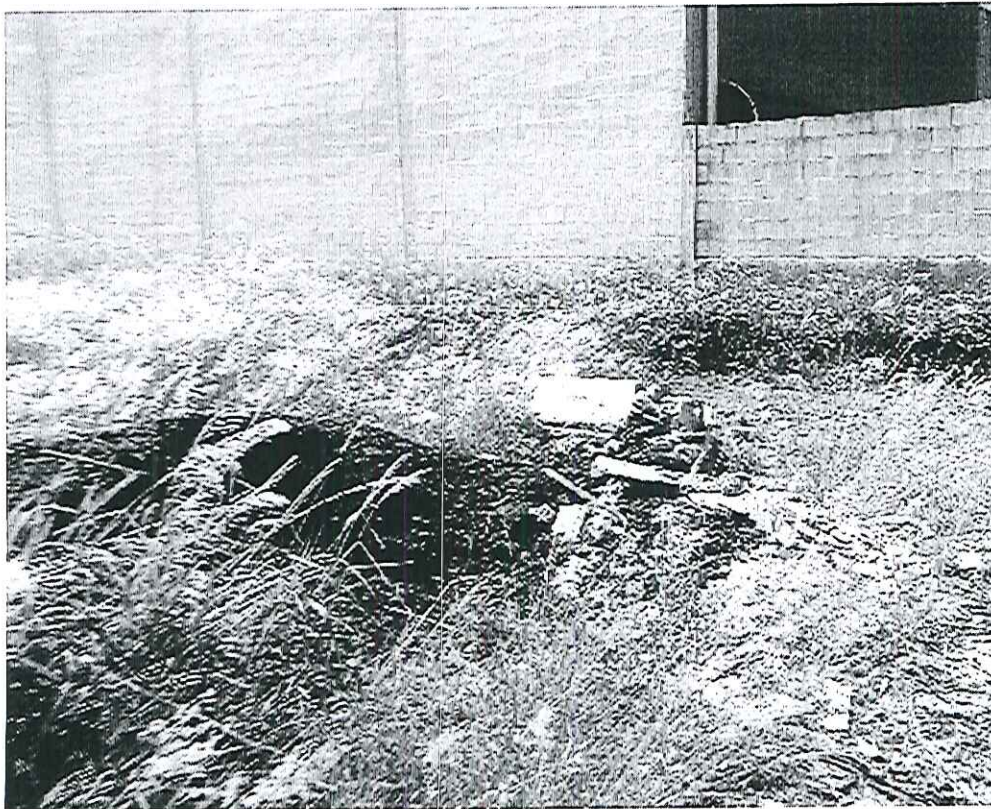
Limpeza e Roçada na Avenida Antônio Pereira de Carvalho com a Rua Luis Soler.