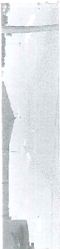
Rua Benedito Oliveira Cavalheiro, 251 Araraquara - SP