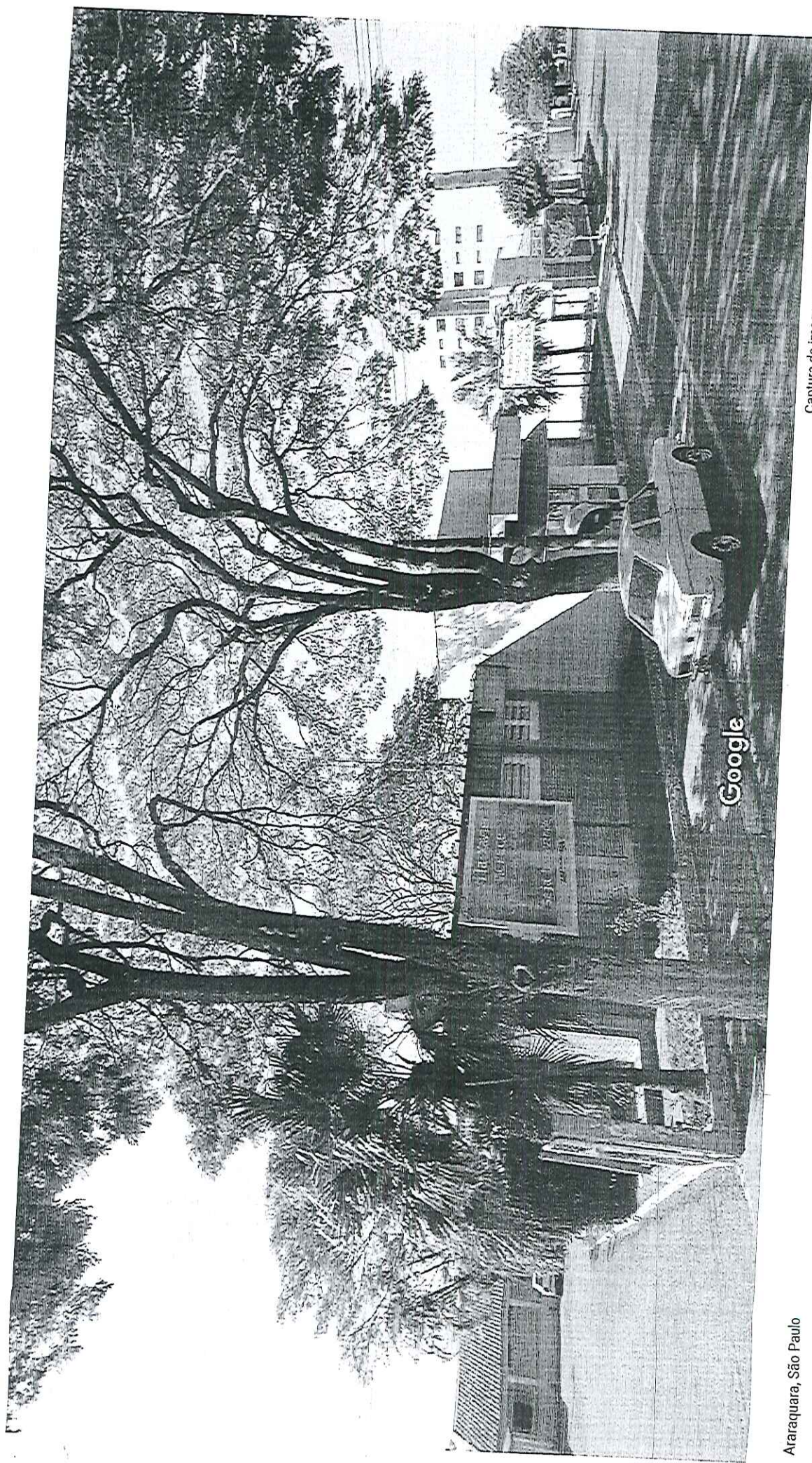
Araraquara, São Paulo Street View - ago 2011