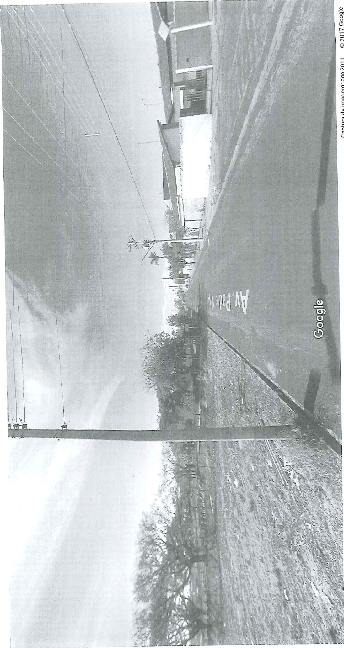
Captura da imagem: ago 2011 © 2017 Google