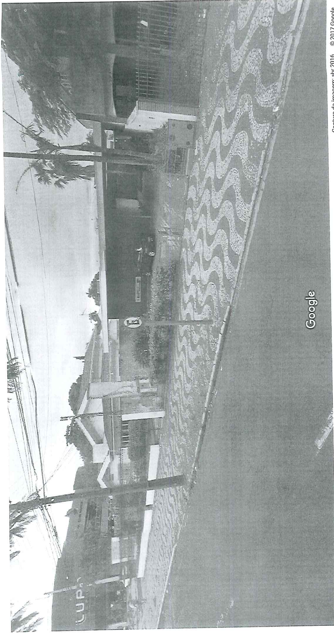
Captura da imagem: abr 2016