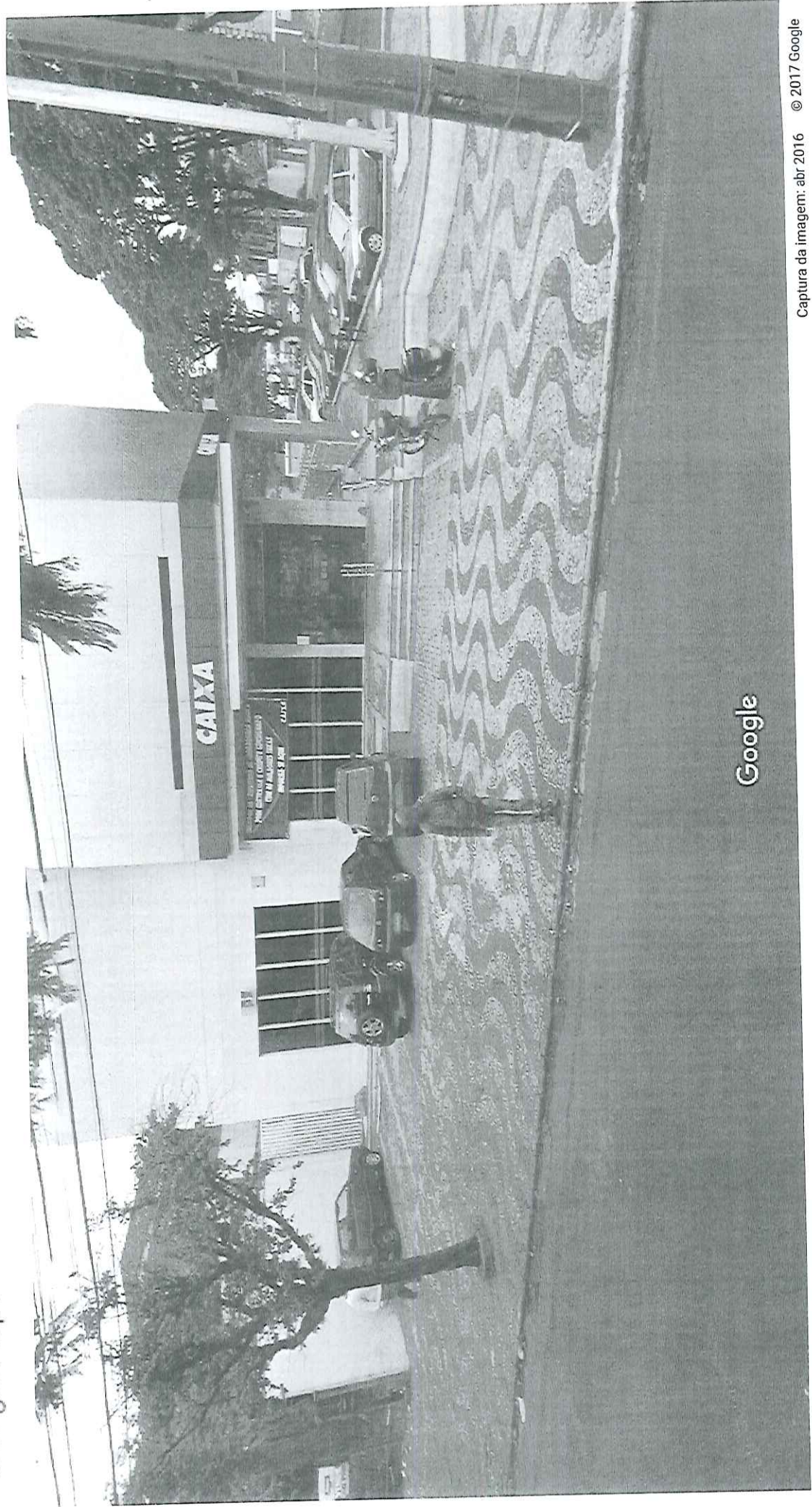
Captura da imagem: abr 2016

Araraquara, São Paulo Street View - abr 2016