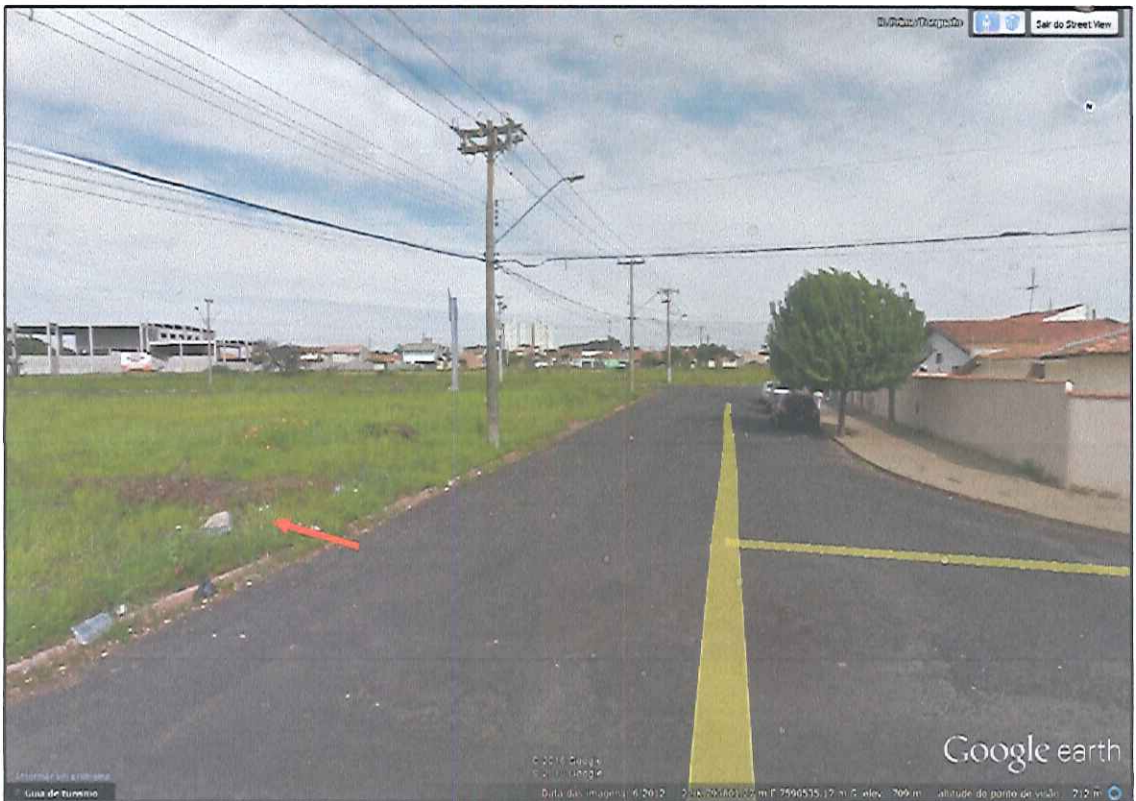
Foto 02. Rua Primo Torquato sentido Avenida Manoel de Abreu, próximo ao cruzamento com a Avenida D. Maria de Lourdes Almeida.