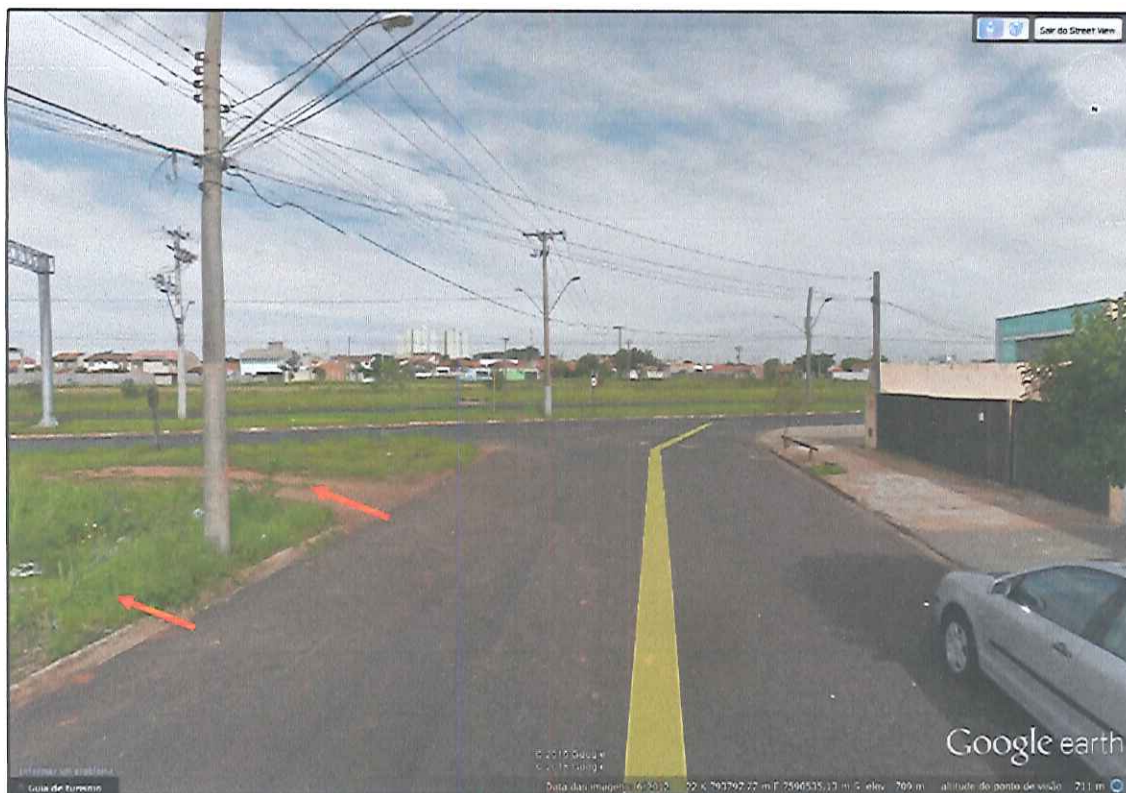
Foto 03. Rua Primo Torquato sentido Avenida Manoel de Abreu.