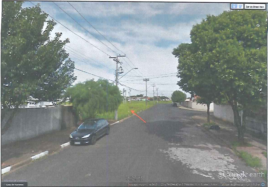
Foto 01. Rua Primo Torquato sentido Avenida Manoel de Abreu.