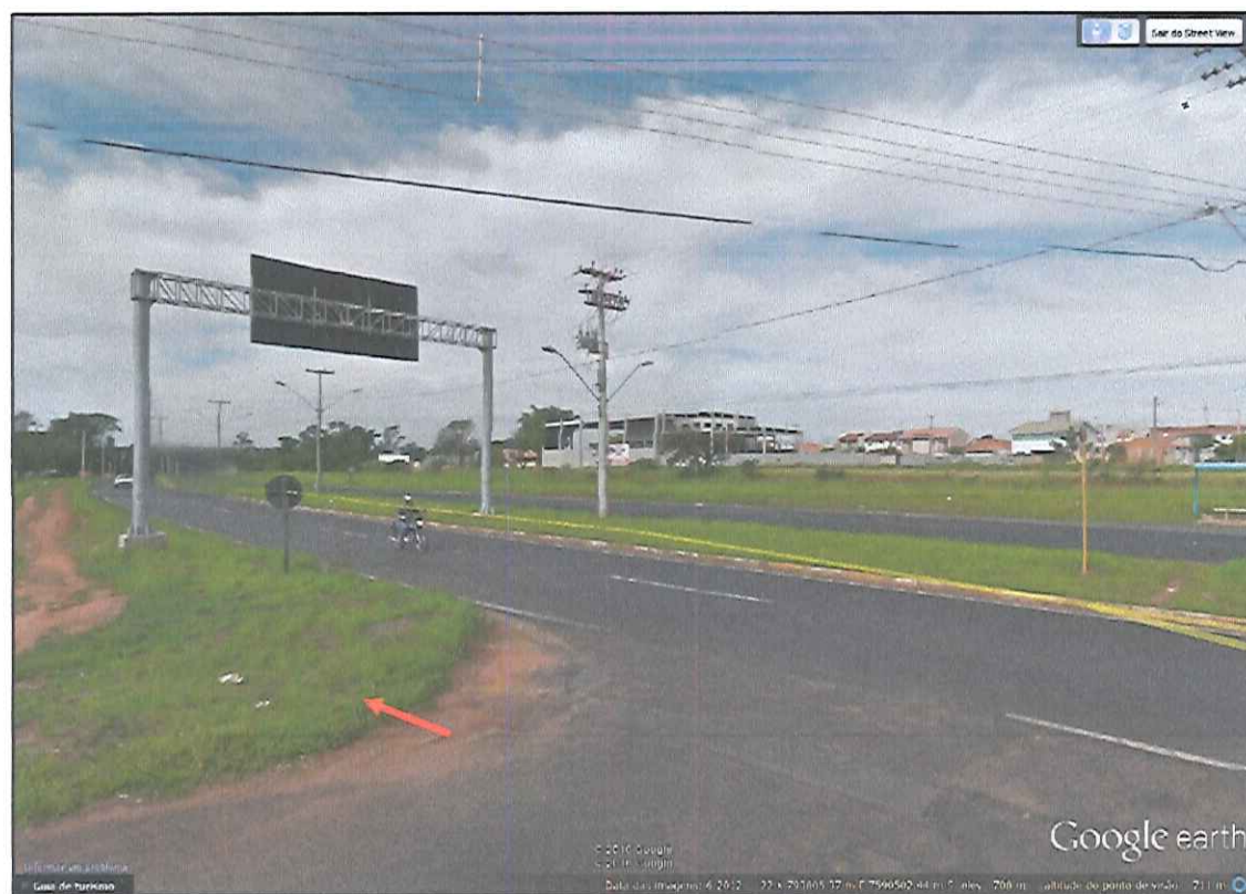
Foto 04. Rua Primo Torquato no cruzamento com a Avenida Manoel de Abreu.