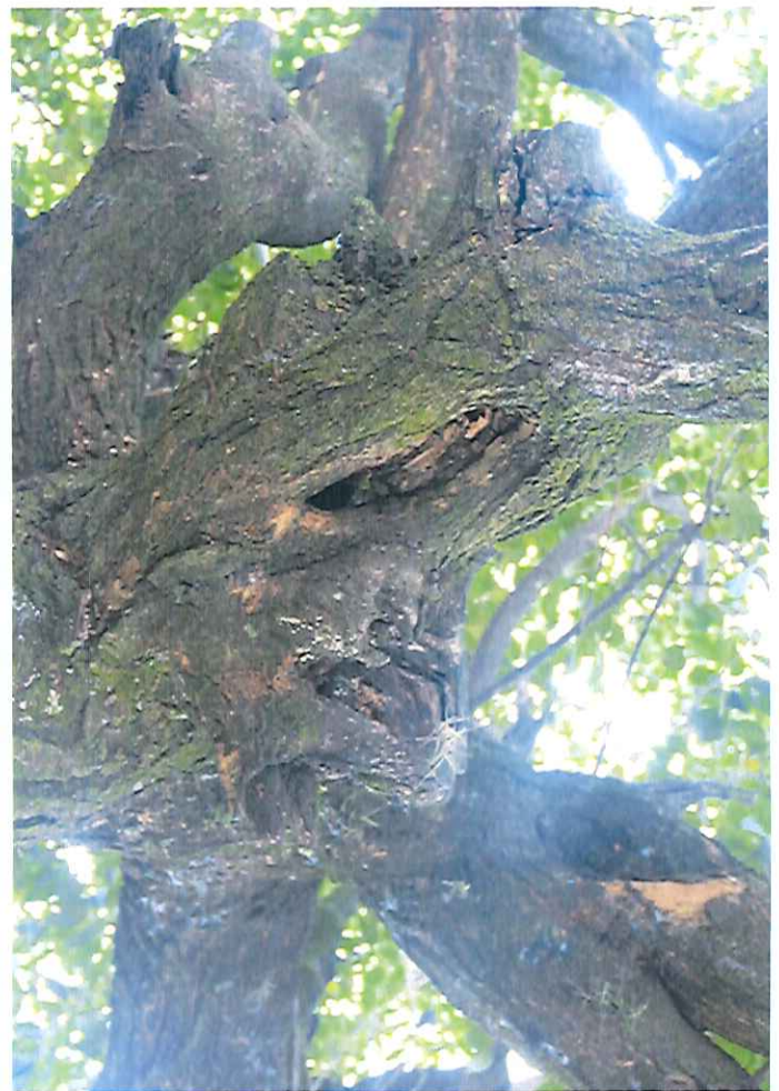
Avenida Padre Antônio Lazzaro